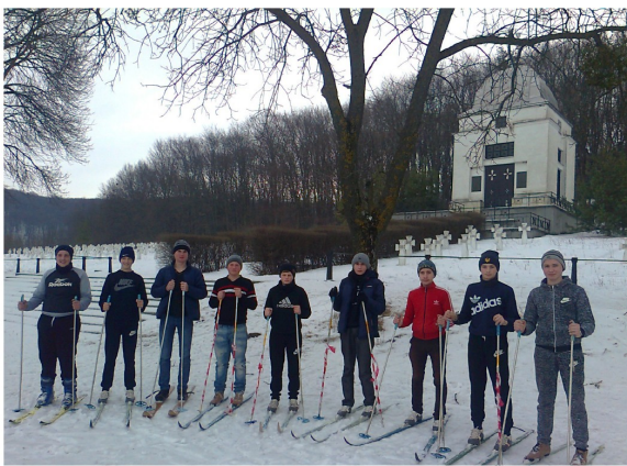
Учні гр. № 11 – підкорювачі гори Жорнавки

« Вірте в себе! Вірте в свої здібності! Без скромної, але розумної впевненості в своїх силах, ви не зможете бути успішними та щасливими» /В.О.Сухомлинський/