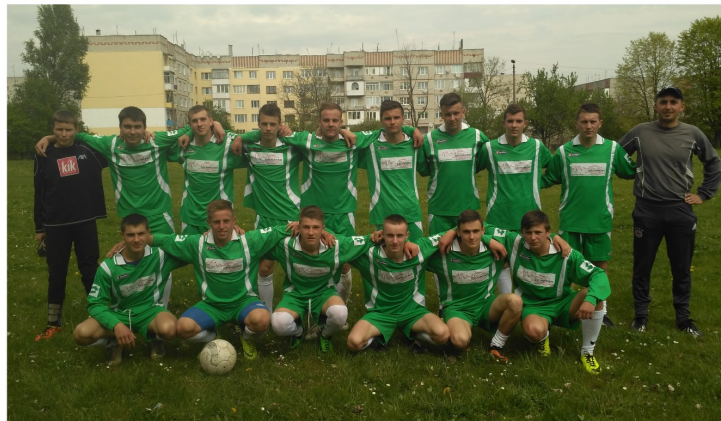
Футбольна команда учнів Червоненського ВПУ неодноразовий фіналіст спортивних ігор ПТНЗ Львівщини